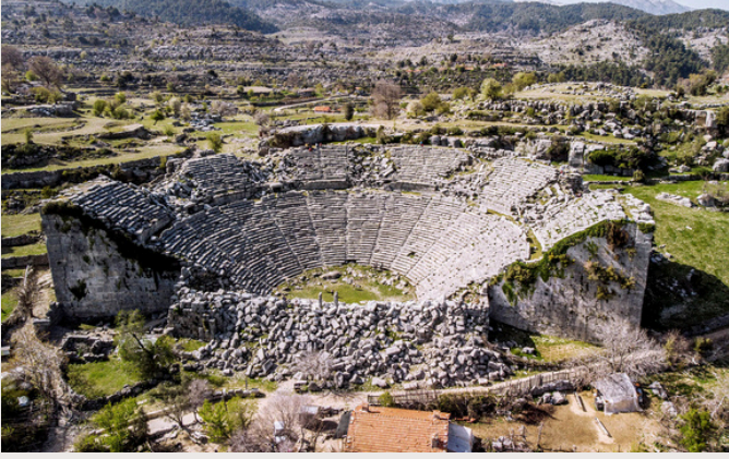
SELGE ANTİK KENT