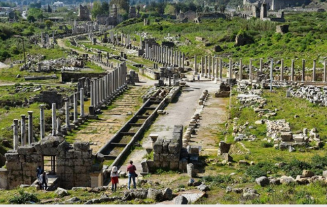
PERGE ANTİK KENTİ