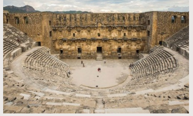
ANTALYA'NIN SERİK İLÇESİNDE BULUNAN ASPENDOS ANTİK TİYATROSU.

Sandy Beach Otel'e en Yakın bulunan Antik Kentimiz Side Antik Kent'tir. Otelimize uzaklığı yaklaşık 3,8 Km'dir. Aspendos Antik Kenti'nin uzaklığı ise yaklaşık 32 Km'dir.