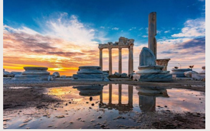
M.S.150 YILI CİVARINDA İNŞA EDİLDİĞİ BİLİNER SİDE 'DE BULUNAN APOLLON TAPINAĞI.